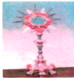
Confraria de Santíssimo Sacramento Penafiel