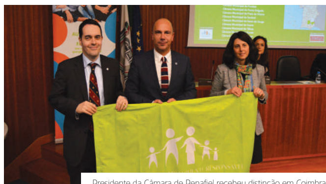
Presidente da Câmara de Penafiel recebeu distinção em Coimbra.

A seleção dos Municípios é feita com base em diversos critérios, entre os quais o apoio à maternidade e paternidade, apoio às famílias com necessidades especiais, serviços básicos, educação e formação, habitação e urbanismo, transportes, cultura, desporto, lazer e tempo livre, cooperação, relações institucionais e participação social.