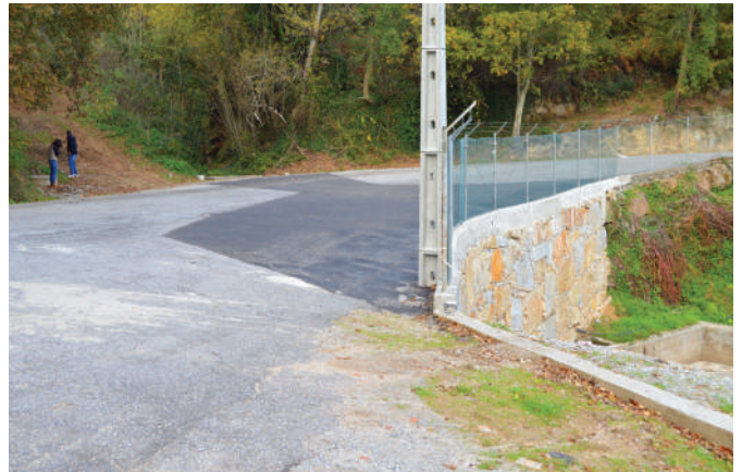
Construção de condutas de águas pluviais na Rua da Ufe.