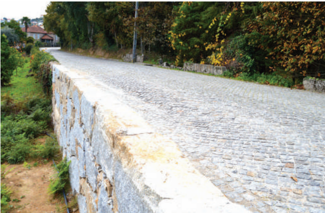
Beneficiação de muro na Rua da Granja à Avenida do Pinheiro.